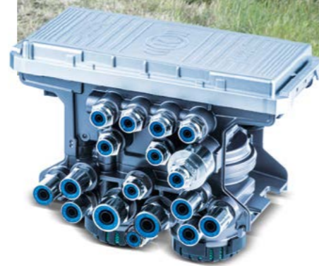
Rieck transportiert für Knorr-Bremse Einzelteile für Nutzfahrzeuge quer durch Europa