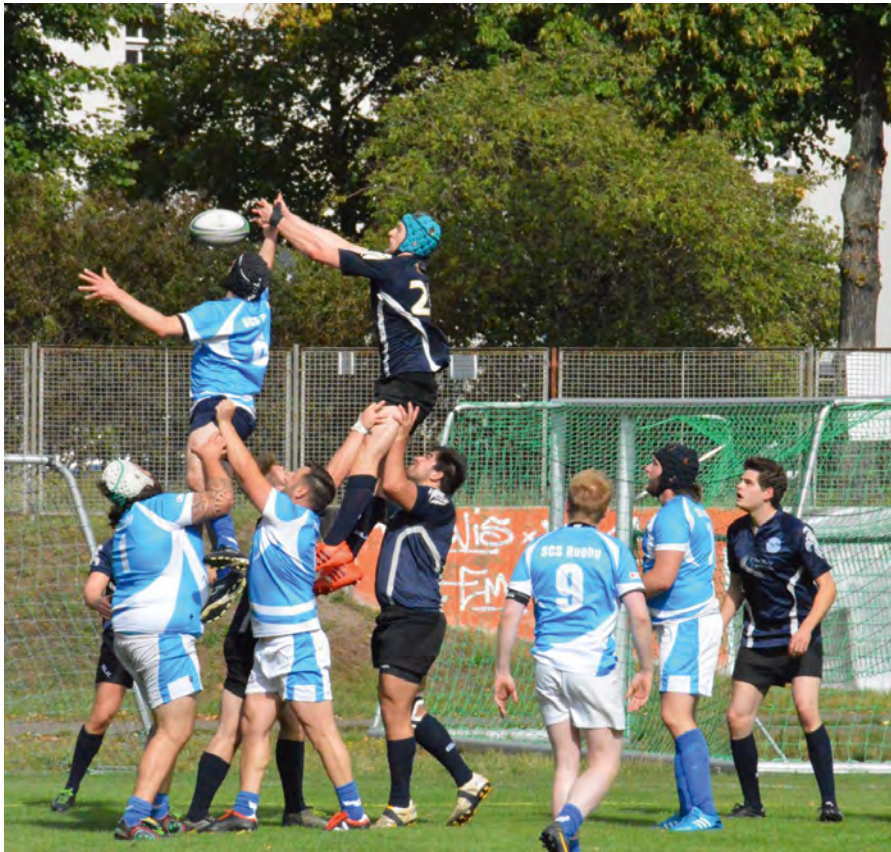
Starker Auftritt: Die Berlin Grizzlies zeigen auf dem Spielfeld und bei Rieck vollen Einsatz.