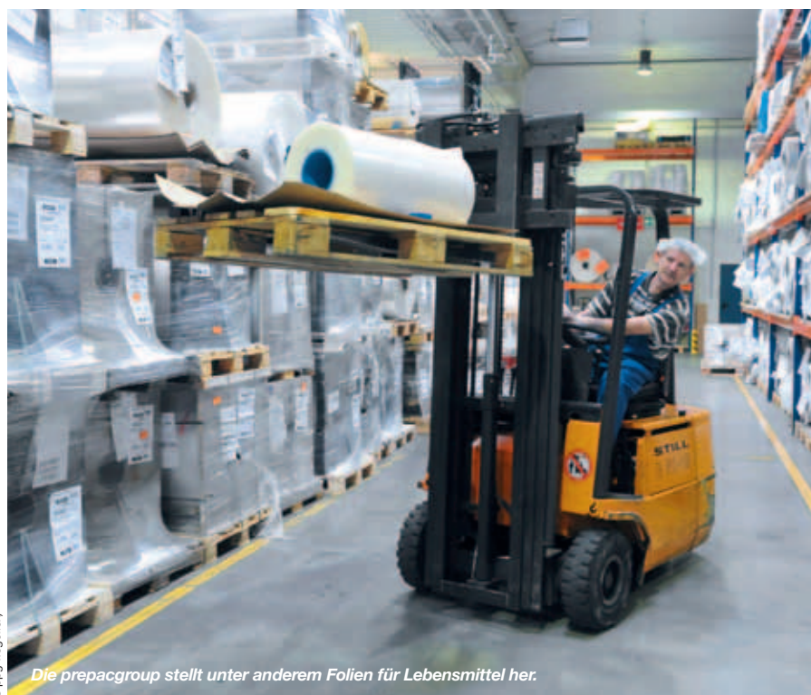
Die prepacgroup stellt unter anderem Folien für Lebensmittel her.

Flexible Verpackungen für Fleisch, Wurst, Käse und Etiketten für Getränkeflaschen oder auch Verbundfolien für Kaffee und Butterverpackungen gehören zu den Produkten, auf die sich die Unternehmen ppg>wegoflex und ppg>noltemeyer spezialisiert haben. Da die Unternehmen der prepacgroup (ppg) nach dem Britischen Hygienestandard für Verpackungsmaterial BRC/IoP zertifiziert sind, müssen auch die Lieferanten und Dienstleister strengen Kriterien genügen. Mit den Logistikleistungen von Rieck sind die Unternehmen der ppg am Standort Trebbin bereits seit vielen Jahren zufrieden.